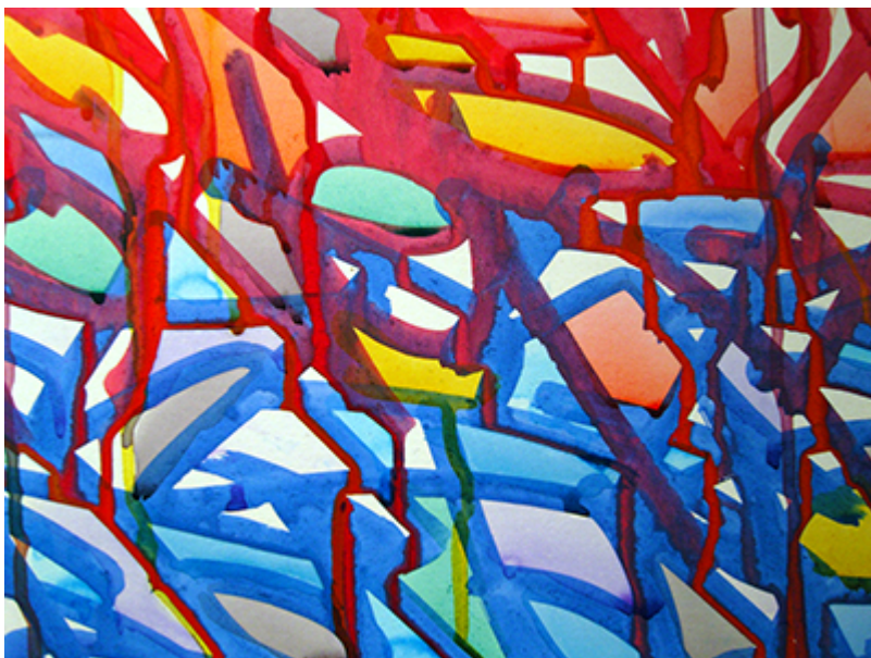
JonOne. Et udsnit af Graffitigalleriets udstilling i 2009.

”Der er noget særligt i, at man tager hen til en lokation, maler et værk eller tag, tager et billede og tager hjem. Og næste dag, så er det måske væk. Men det er dette foto, der er det vigtige og selvfølgelig at andre fra miljøet ser værket inden det forsvinder igen.”