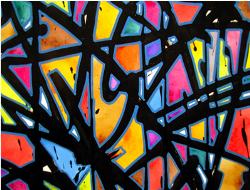
JonOne. Et udsnit af Graffitigalleriets udstilling i 2009.