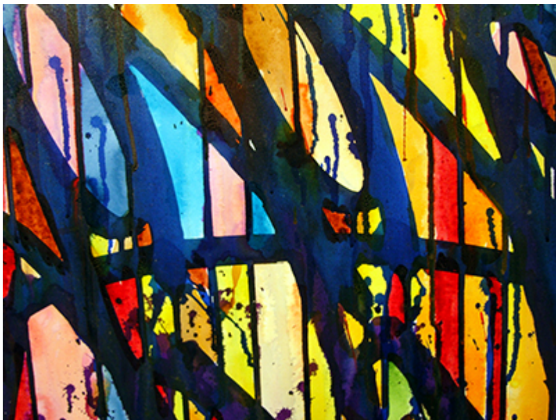
JonOne. Et udsnit af Graffitigalleriets udstilling i 2009.

Der var præstige i at have et hyppigt fremtrædende tag og alias, og i takt med at gadens murværk blev fyldt, blev det nødvendigt at skille sig ud fra mængden.