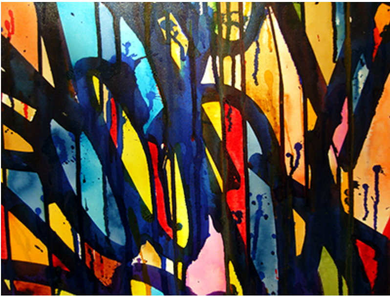
JonOne. Et udsnit af Graffitigalleriets udstilling i 2009.